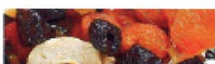
Schwefeldioxid und Sulphit