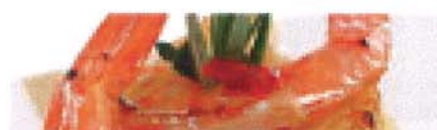
Krebstiere (Krustentiere bzw. Crustaceae)